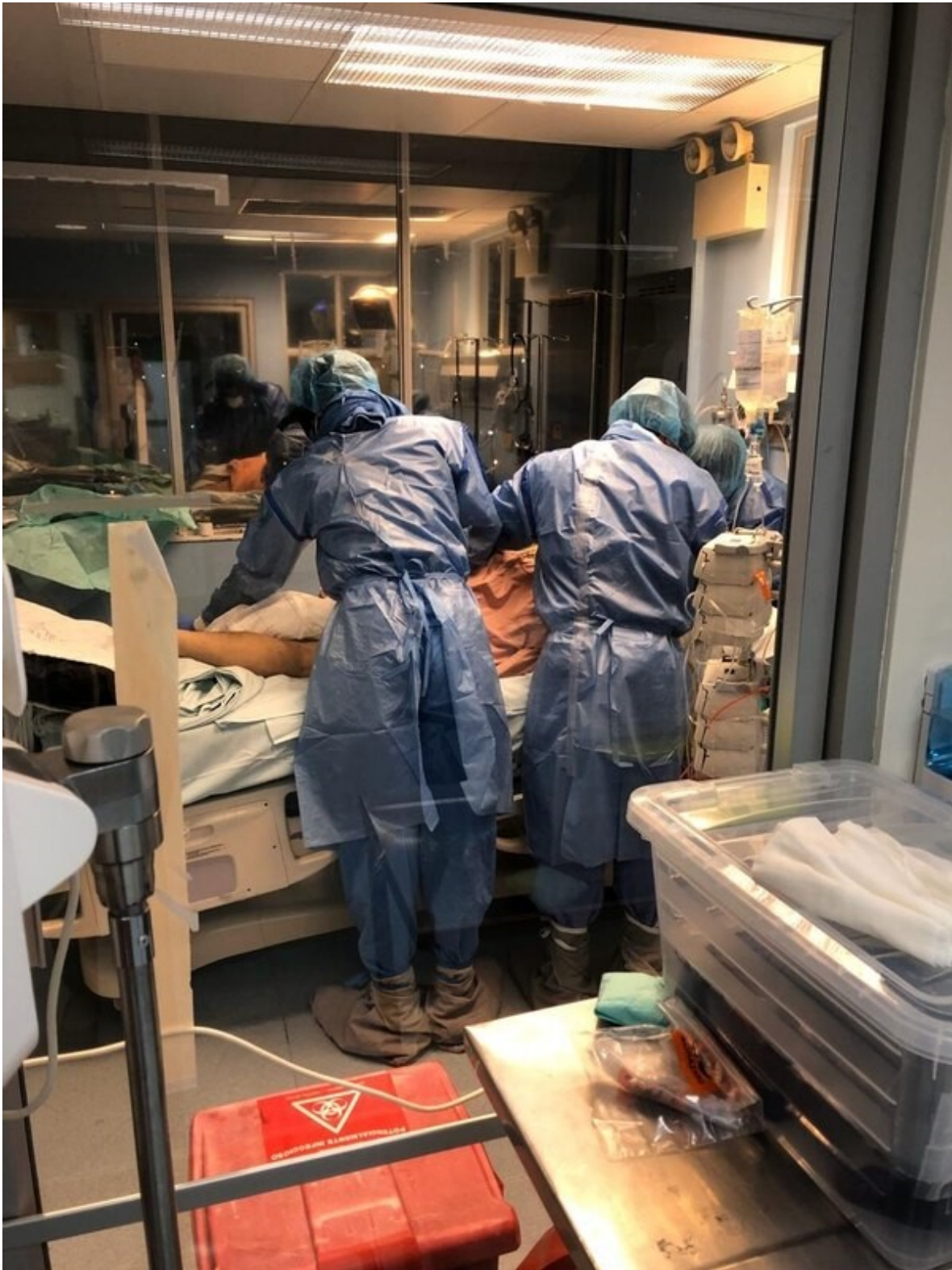
El Hospital México ha tenido que abrir una Unidad de Cuidados Intermedios para ampliar la capacidad de atención de infectados con el coronavirus. Para esto, ha recurrido a la contratación de medio centenar de profesionales, con el fin de sacar adelante la tarea.